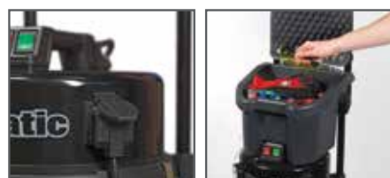
Prise pour outil électroportatif